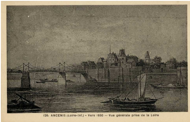
128. ANCENIS (Loire-Inf.) - Vers 1850 - Vue générale prise de la Loire