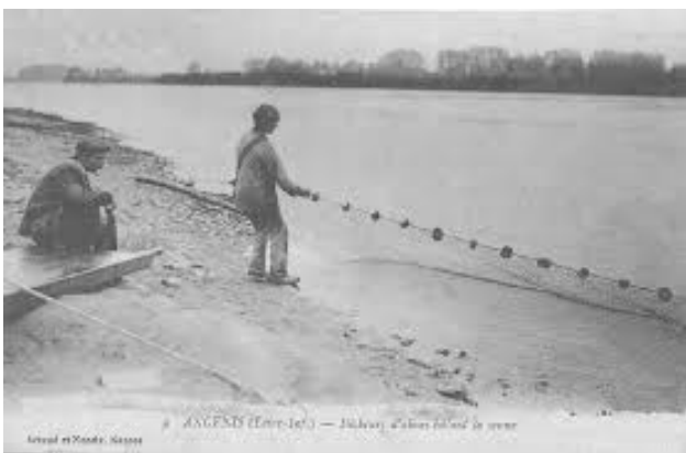
ANCENIS (Loire-Inf.) - Pêcheurs, Ancenis